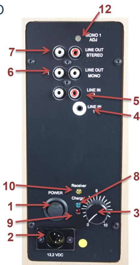
Figur 1 Bakside med kontrollere og tilkoblinger