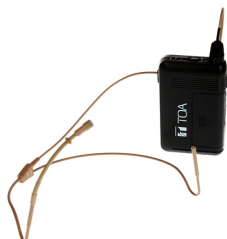
HODEB3-S2 Varenr. 1174