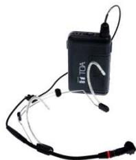
HODEB1-S2 Varenr. 1172