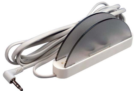
Sensor med tilhørende borrelåstape og spritserviett.