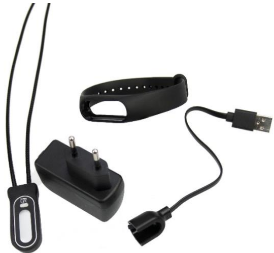
Figur 1 ELLA, holder med sikkerhetssnor, armbånd, lader og ladekabel