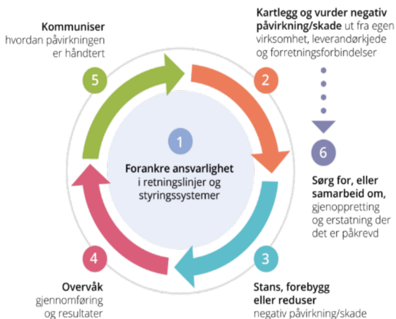
Figur 2 Aktsomhetsmodellen finner du her .

Aktsomhetsmodellen har seks trinn som beskriver hvordan et selskap kan jobbe for mer ansvarlig og bærekraftig forretningspraksis. Å være god på aktsomhetsvurderinger betyr ikke at selskapet ikke har negativ påvirkning på mennesker, samfunn og miljø, men heller at selskapet er åpen og ærlig om utfordringer, og håndtere dette på best mulig måte i samråd med sine interessenter.