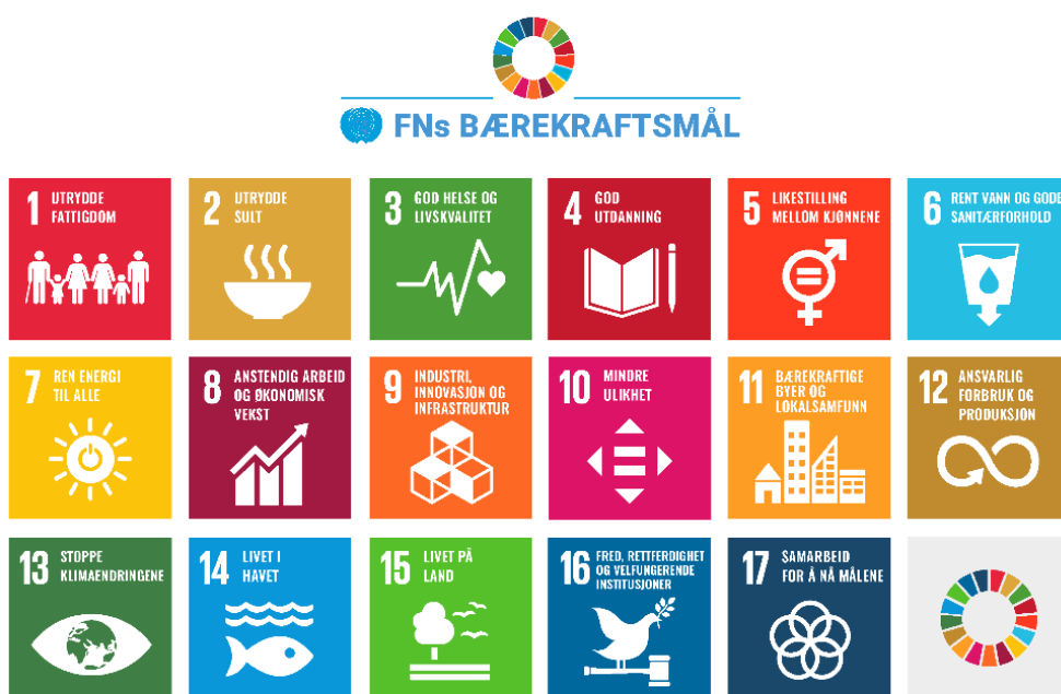
Figur 1, trykk på bilde for å komme til bærekraftsmålene